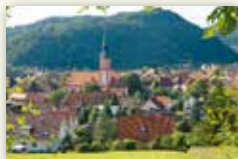
Stadt Waldkirch www.stadt-waldkirch.de