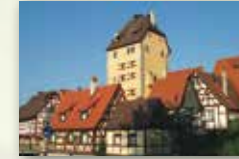
Stadt Hersbruck www.hersbruck.de