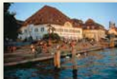
Stadt Überlingen www.ueberlingen.de