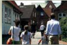
Stadt Meldorf www.meldorf-nordsee.de