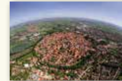
Stadt Nördlingen www.noerdlingen.de