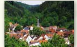
Markt Wirsberg www.wirsberg.de