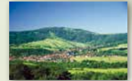
Stadt Bischofsheim a. d. Rhön www.bischofsheim.info