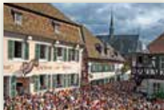
Stadt Deidesheim www.deidesheim.de