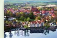
Stadt Penzlin www.penzlin.de