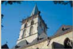
Stadt Lüdinghausen www.luedinghausen.de