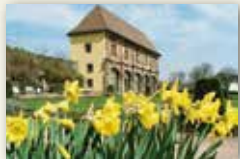
Stadt Blieskastel www.blieskastel.de