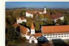
Stadt Bad Schussenried www.bad-schussenried.de