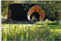
Stadt Bad Essen www.badessen.de